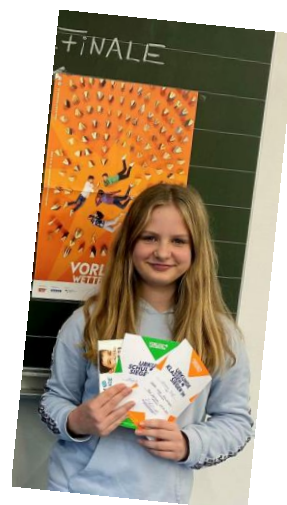
Von Kristina Wahl

Mareike freut sich nun auf die Teilnahme am Kreiswettbewerb, der im kommenden Jahr stattfinden wird.