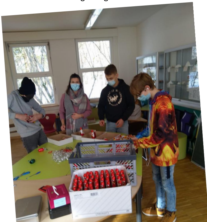
Einige Mitglieder der SMV bei der Vorbereitung der Nikolausaktion.

Coronabedingt gab es leider keinen Weihnachtsmarkt auf dem Schulhof, dafür lief die Nikolausaktion der SMV umso erfolgreicher und wurde von den Schülern des Schulverbundes sehr gut angenommen.