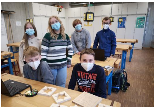
Schülerinnen und Schüler mit einigen Ihrer Werkstücke